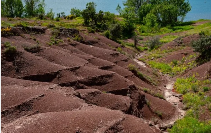
Crédit photo : Salagou baie des Vailhès, volcan et ruffes (Philippe Marza)