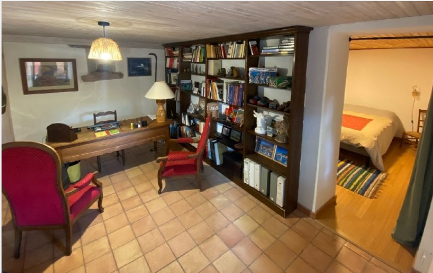
« L'ecriveire public », une chambre-bureau