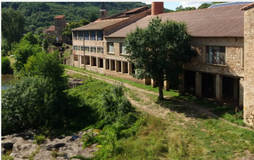
Le plateau de la loubiere par clipis (Roquefort Tourisme)