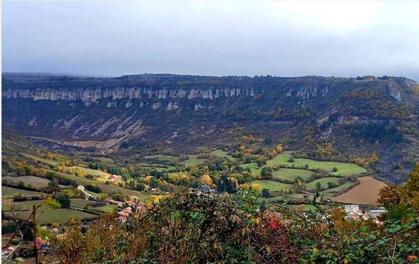
Sentier de Trompette (Roquefort Tourisme)