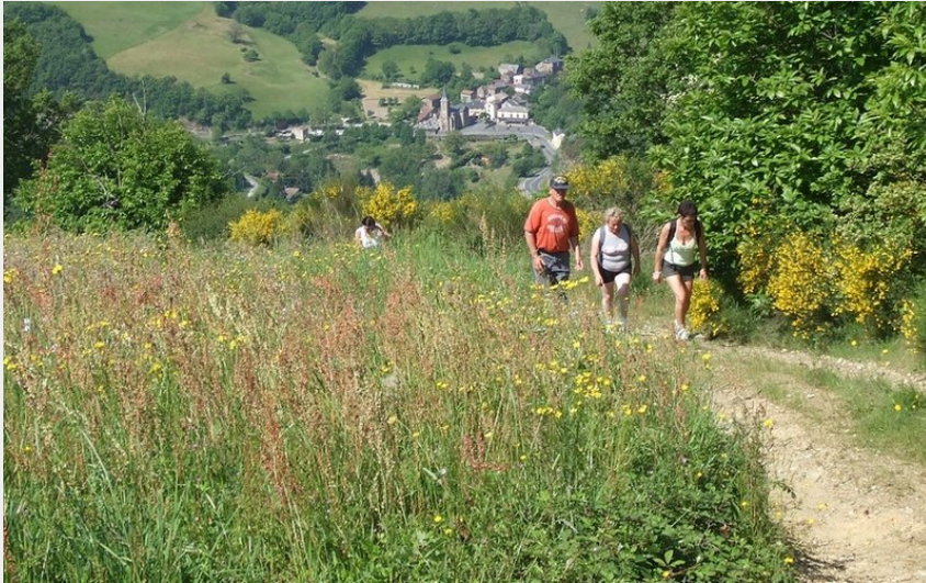
vue vers Bajaguet (OT Rougier Aveyron Sud)