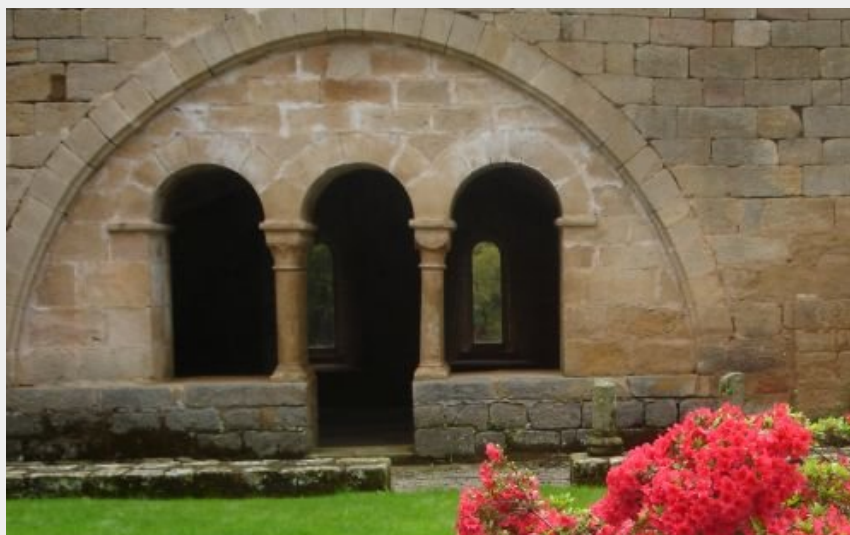
Cloître de Comberoumal