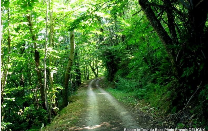
Balade autour du Bosc (Francis Deligny)