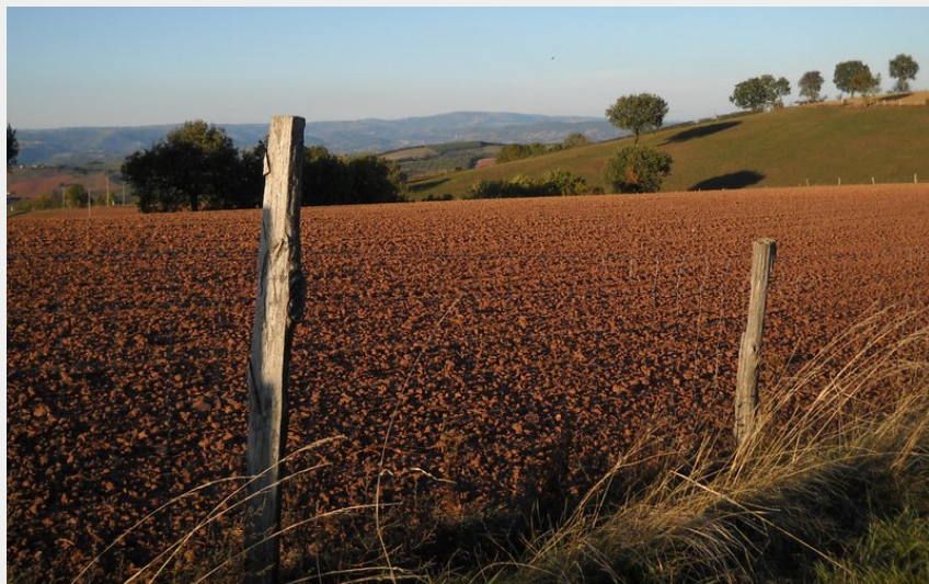
(OT Rougier Aveyron Sud)