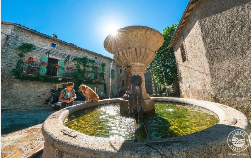
Sauclières, sa place, sa fontaine... (Virginie Govignon - OT Larzac et Vallées)