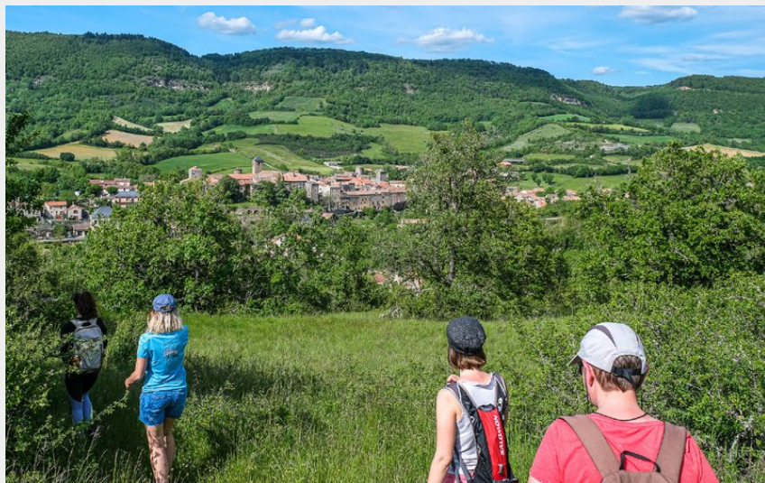
Panorama sur Ste-Eulalie depuis le Puech Aubert