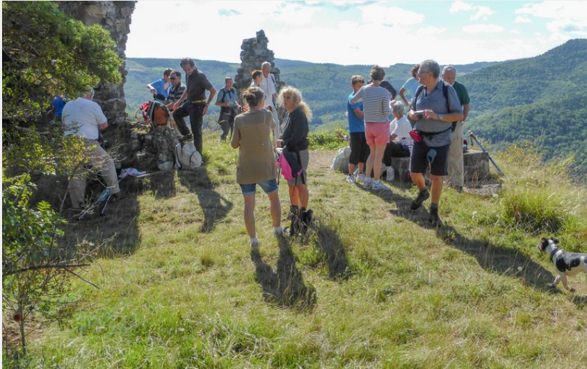
Les ruines du château (Escapade St-Jeantaise)