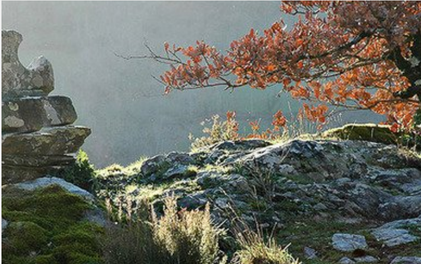
(Commune de Brousse-le-Château)