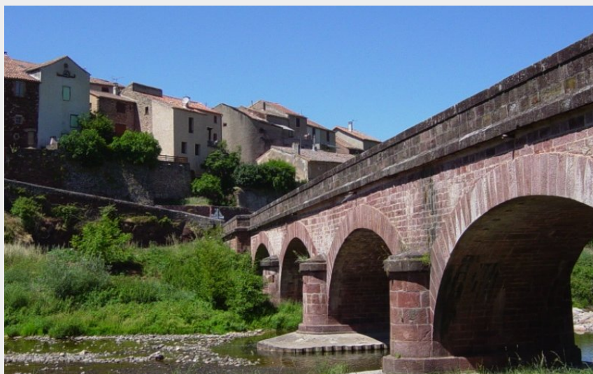
Pont de Montlaur