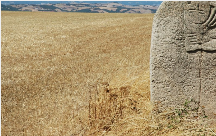
Statue-Menhir du Plo du Mas Viel