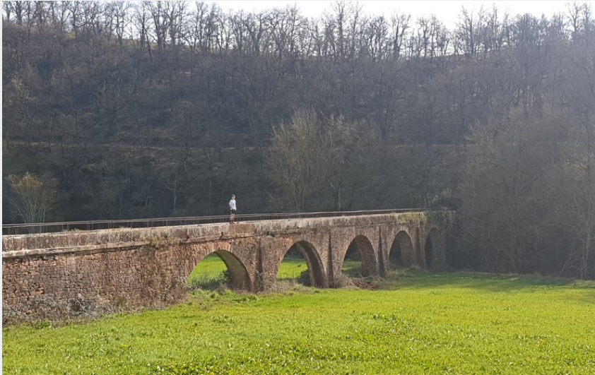
Aqueduc du Graouzou