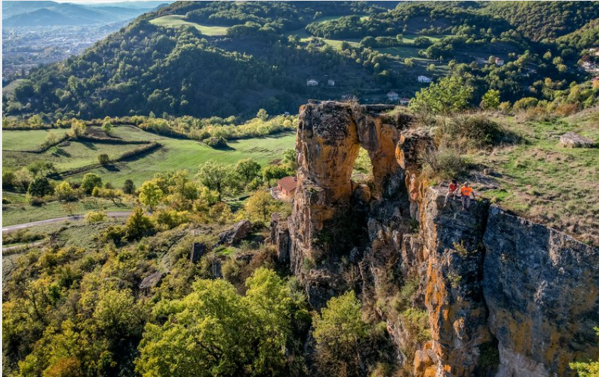
Rocher de Caylus (Virginie Govignon)