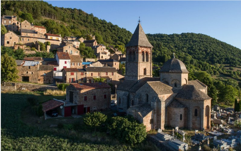
Village de Montjoux (Dominique SERIN)