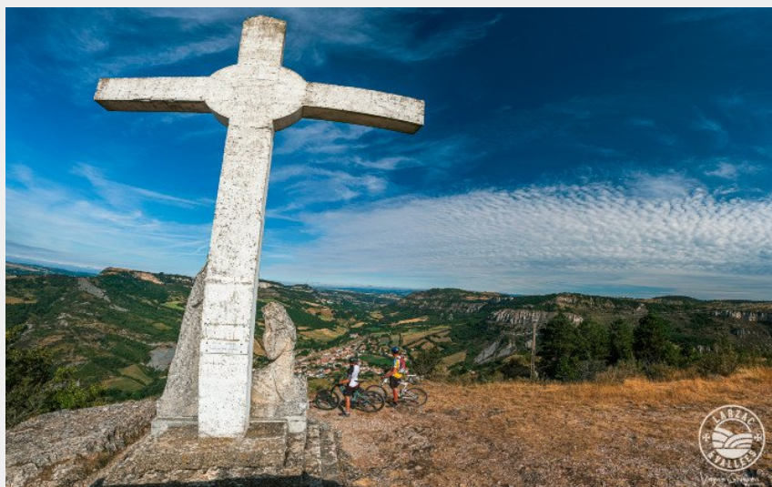
Le panorama depuis la croix de Gréponac