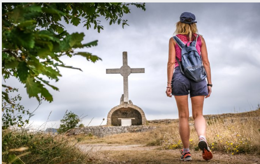
La croix de Gréponac