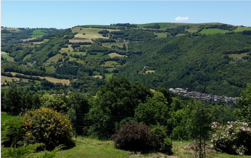
Sur les hauteurs de St Sernin (Nespoulous)