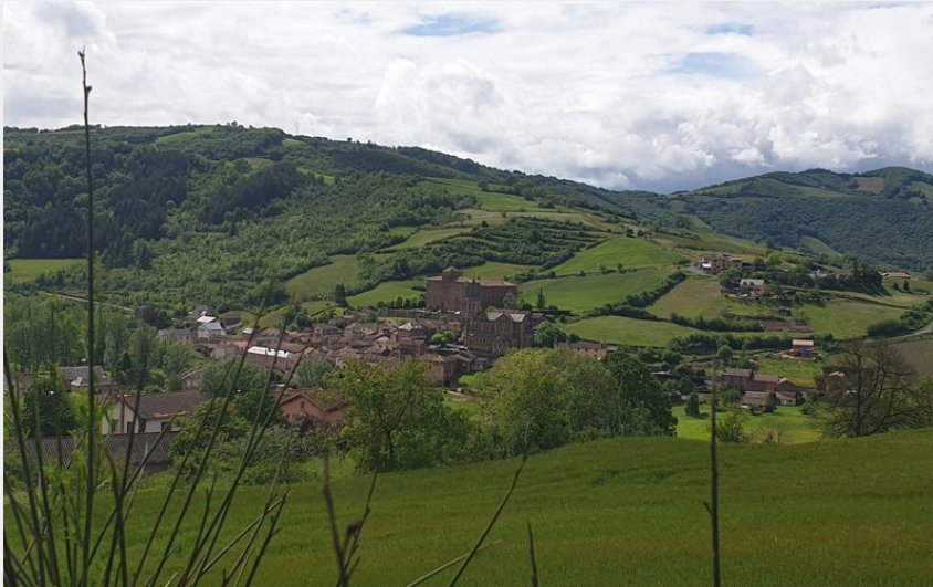
Saint Izaire (Roquefort Tourisme)