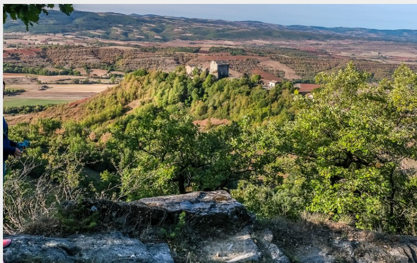
Vue sur le Château de Montaigut (V.Govignon)