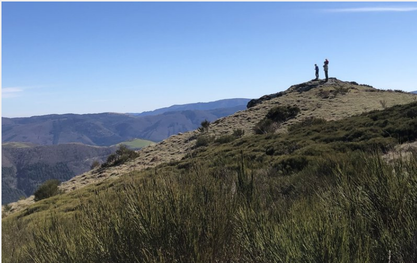
Sommet du Merdelou