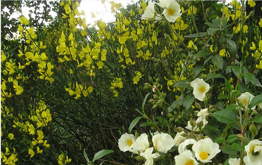
Genêts et Ciste (OT RAS)