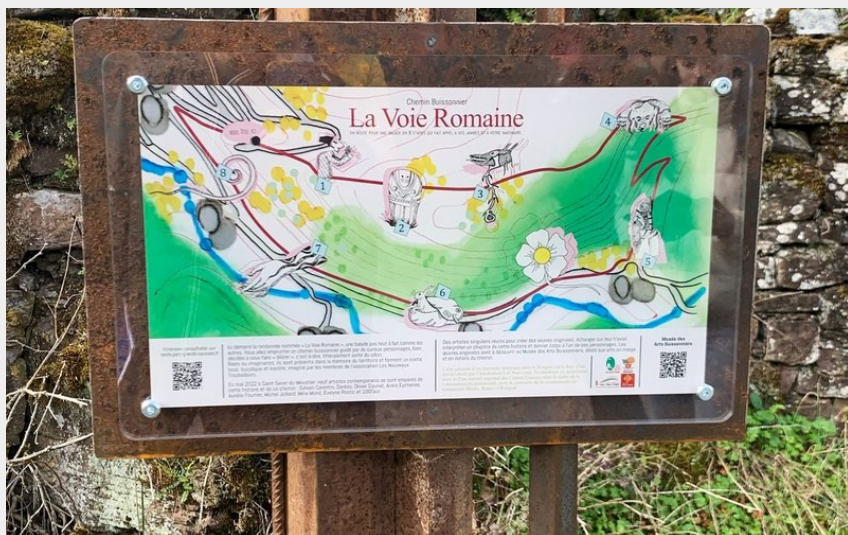
Départ voie romaine (OT RAS)