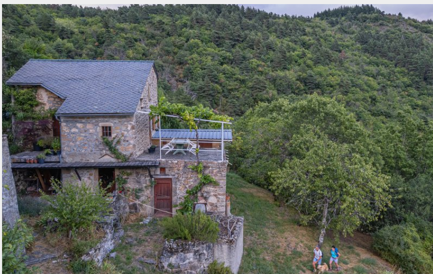
La Brunelerie