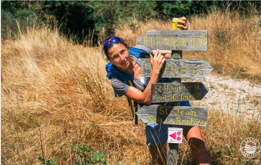
Sur le circuit...