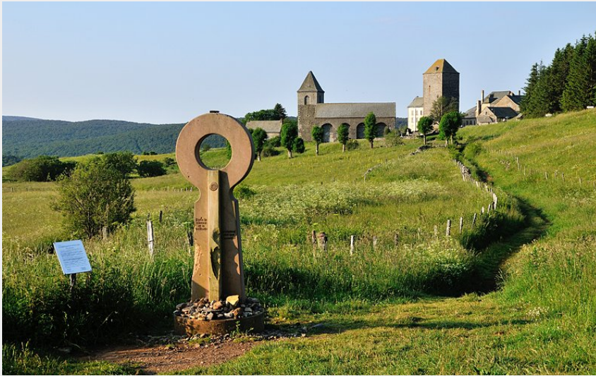
Vue sur le village d'Aubrac