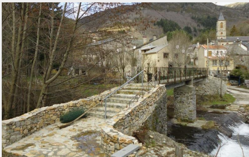
Passerelle du départ (Mairie)