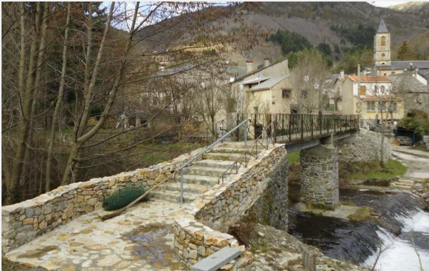
Passerelle du départ (Mairie)