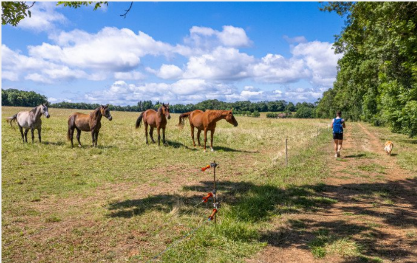
Autour de La Fageole