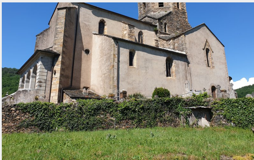
Plaisance (Roquefort Tourisme)