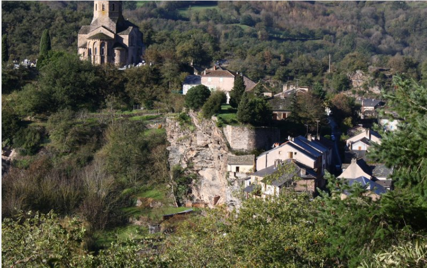
Vue sur village de Plaisance (Isabelle Guerrier)