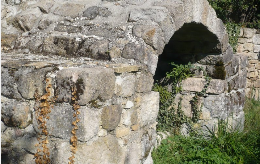
Fontaine de st Laurent