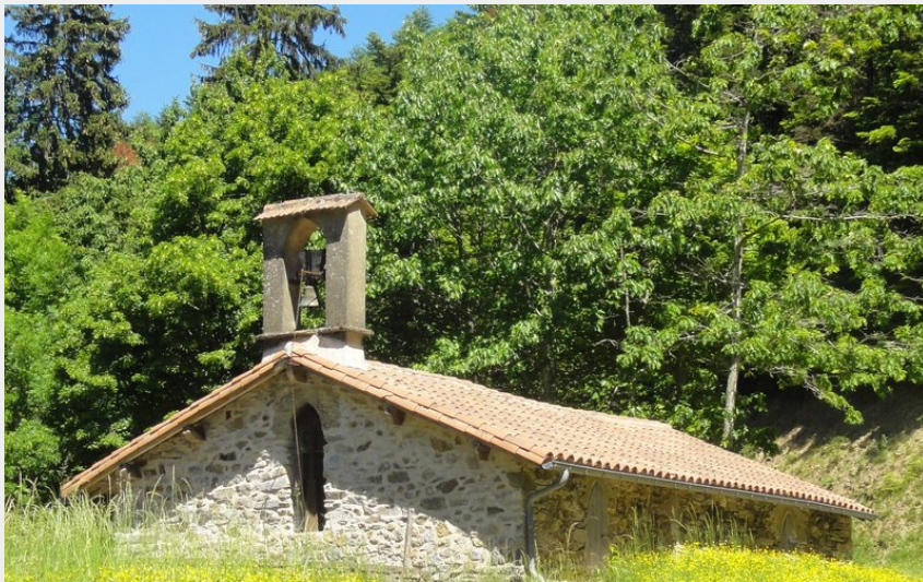
Ermitage St Thomas (C.Bouzat)