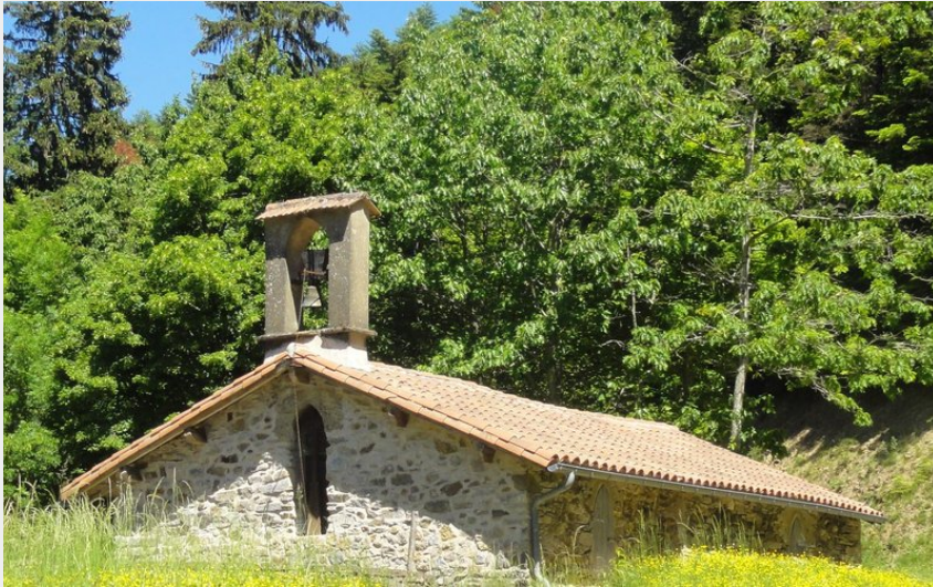
Ermitage St Thomas (C.Bouzat)