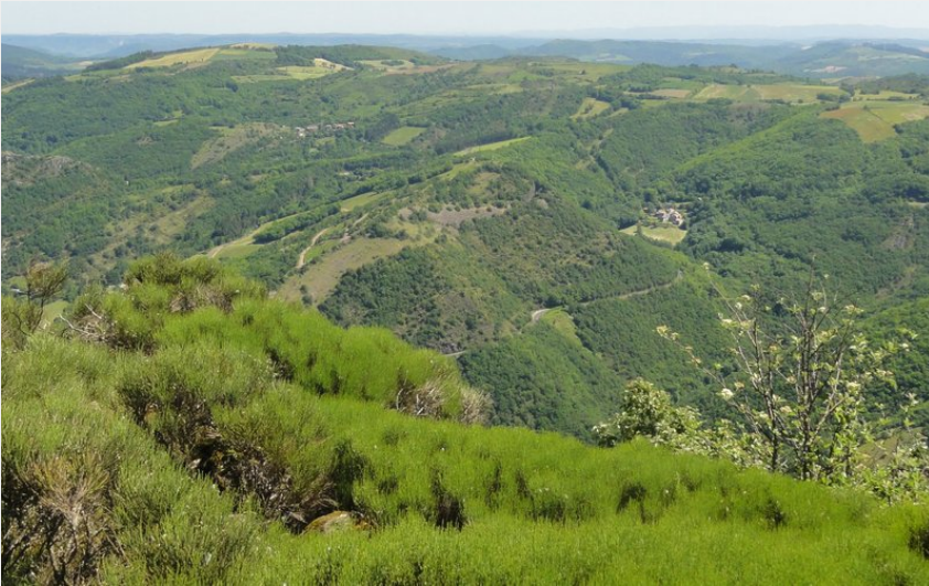
Vue du Sommet du Maliver (C.Bouzat)