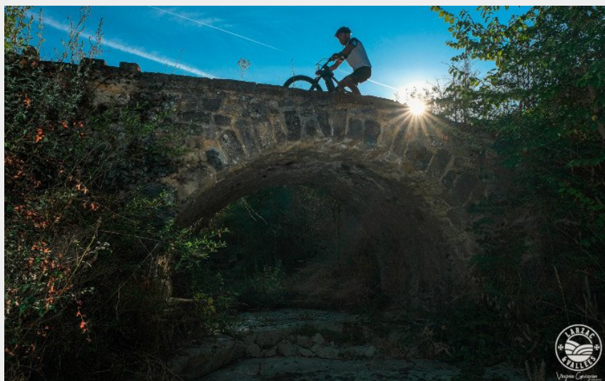
Sur le pont romain