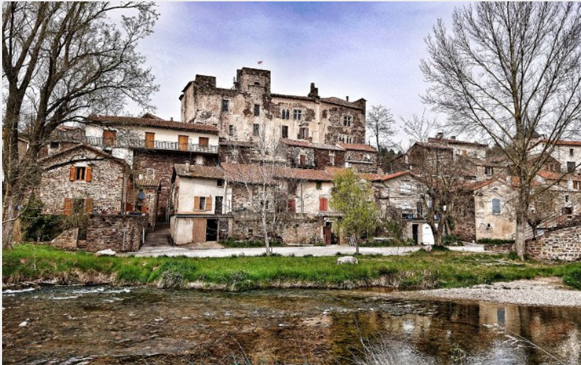
Le château de Latour