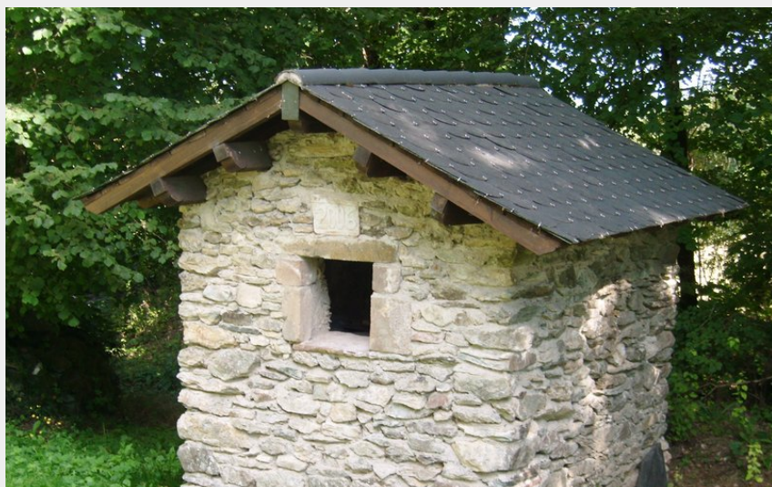
Puit (OT Rougier Aveyron Sud)