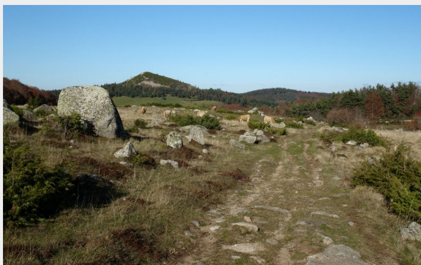
Le Pic de Mus et les pâtures de St-Laurent-de-Muret (PNR Aubrac)