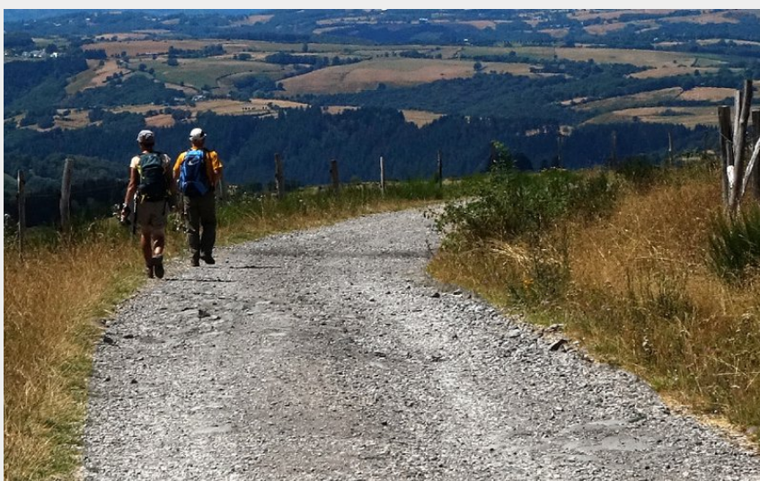
Randonneurs marchant vers le hameau des Enfrux (PNR Aubrac)