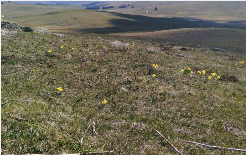
Les perspectives du haut-plateau (PNR Aubrac)