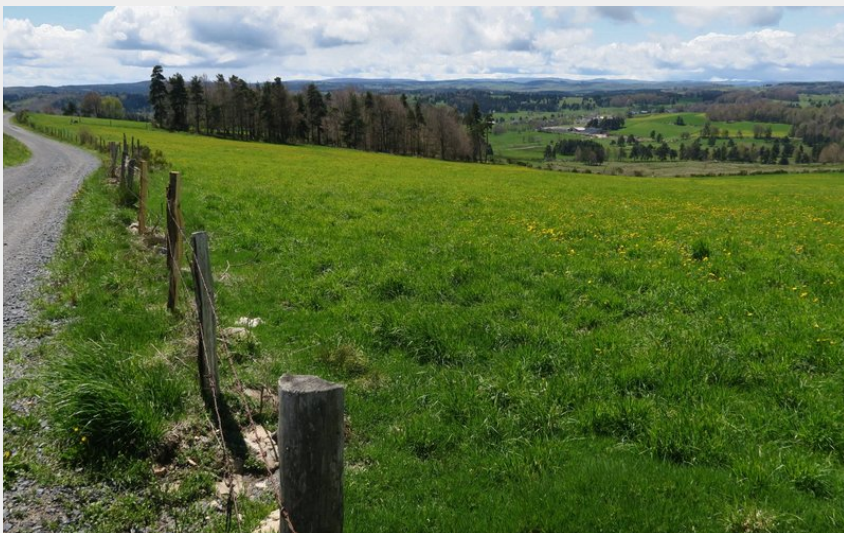
Les dernières vue sur le plateau de l'Aubrac avant de rejoindre les abords de la Margeride (PNR Aubrac)

CC des Hautes Terres de l'Aubrac - Termes