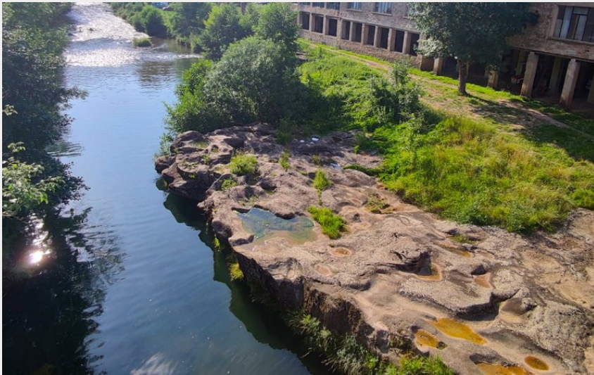
Traversée de la Sorgues depuis le pont neuf de Lapeyre