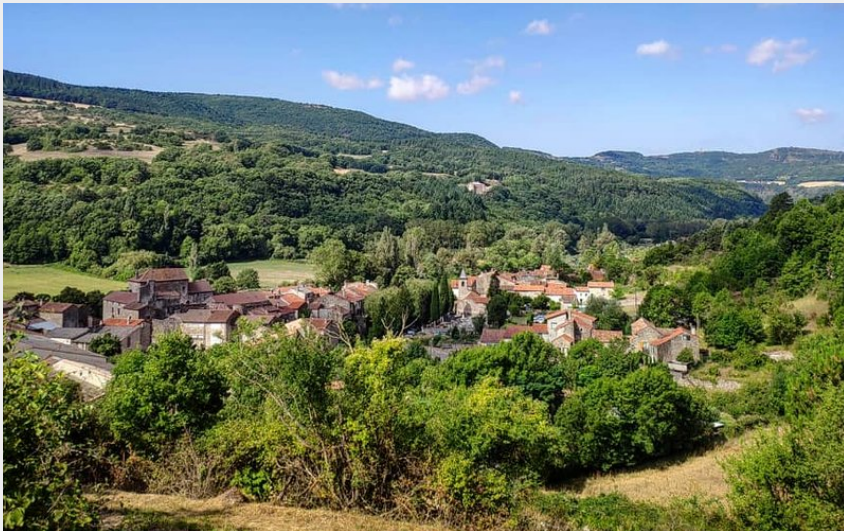
Village de Versols (Delphine Atche)

Des falaises de Roquefort au Rougier - Versols-et-Lapeyre