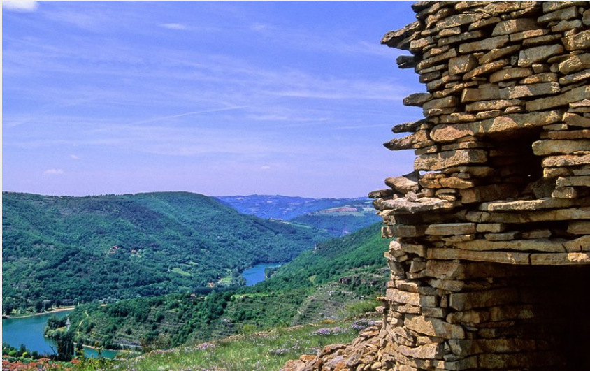
Point de vue sur la Vallée du Tarn (Pol BOUSSAGUET)