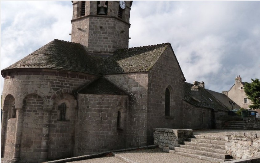
Eglise Sainte-Marie à Nasbinals (Thérèse GAIGE)