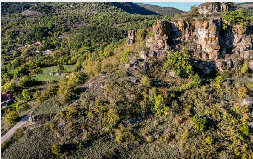
Caylus (Virginie Govignon)