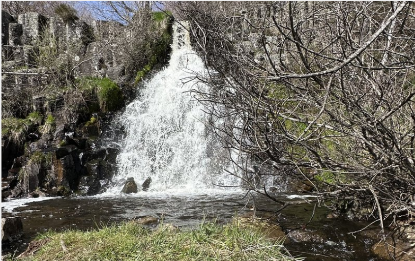
Cascade du Saltou. (Camille ALMERAS OTAGDT)